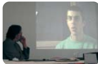
Vidéoprojection lors du séminaire du 29 septembre.