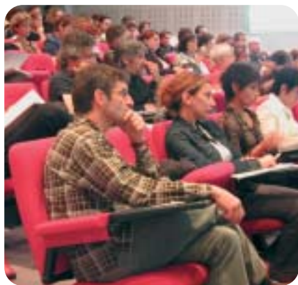
Le public lors du séminaire régional du 20 octobre à Pessac.

- Le Comité de veille, plus étoffé, qui rassemble l'ensemble des institutions concernées. Il a plutôt une fonction d'observatoire et de pilotage des politiques locales de prévention des exclusions des jeunes. Mais dans la pratique, il peine à