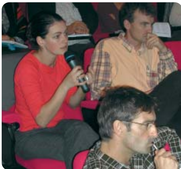
Des intervenants dans le public.